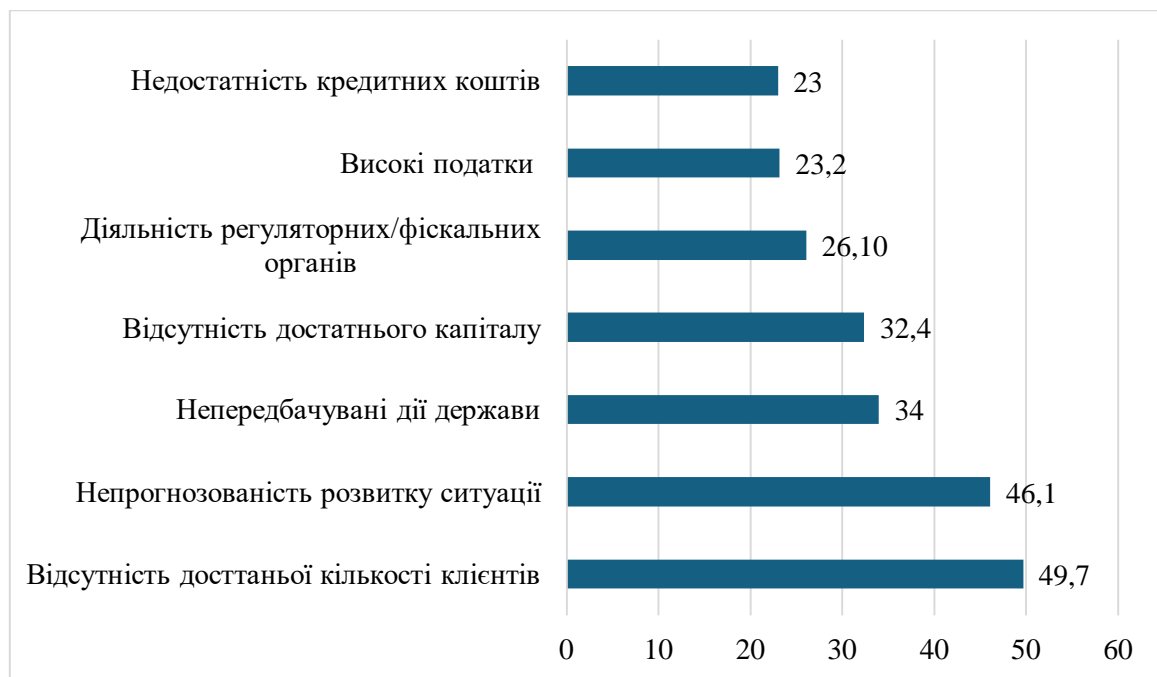
Рис. 2. Основні перешкоди розвитку та відновленню малого бізнесу в Україні