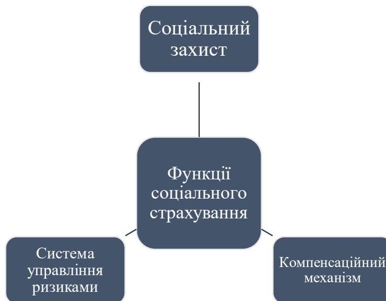
Рис.1. Функціональна природа страхування від нещасних випадків

3. Система управління ризиками — компонент, спрямований на запобігання виробничим небезпекам шляхом оцінювання, аналізу та мінімізації ризиків. Ця система включає використання сучасних аналітичних інструментів, цифрових технологій моніторингу, диференційованих тарифів та нормативних заходів профілактики. В контексті страхування вона відіграє роль не лише у фінансовій нейтралізації наслідків нещасних випадків, але й у створенні більш безпечних умов праці, перетворюючи страхування з реактивного механізму відшкодування збитків на активний інструмент підтримки виробничої безпеки.