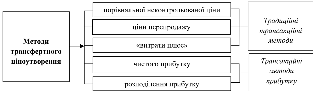
Рис. 2. Методи трансфертного ціноутворення

неконтрольованої ціни, метод ціни перепродажу, метод «витрати плюс», метод чистого прибутку, метод розподіленого прибутку. Зазначені методи відображені на рис. 2 є загально визнаними на міжнародному рівні та рекомендовані Настановами ОЕСР для здійснення оцінки трансфертного ціноутворення.