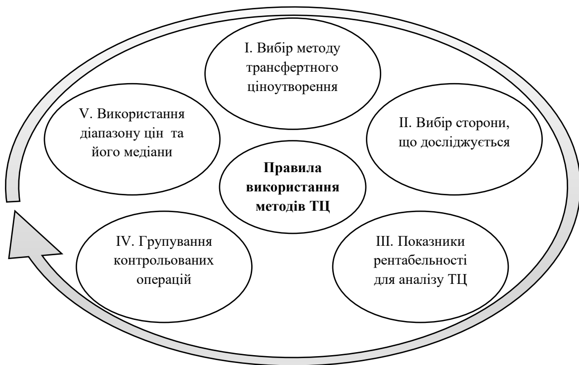
Рис. 1. Загальні правила використання методів для встановлення відповідності умов контрольованих операцій принципу «витягнутої руки»

Загальні правила використання методів трансфертного ціноутворення для встановлення відповідності умов контрольованих операцій принципу «витягнутої руки» представлені на рис. 1.