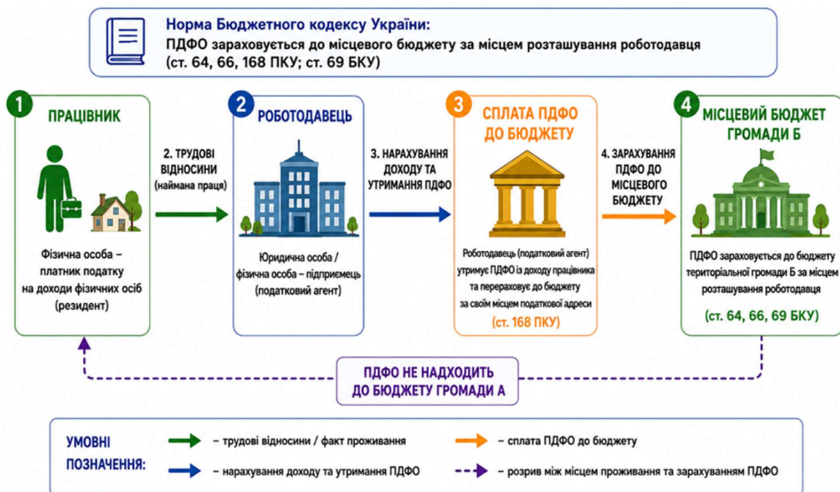
Рис. 1. Схема розподілу ПДФО між громадами відповідно до норм Бюджетного кодексу України

Згідно з українським податковим та бюджетним законодавством [2, 11], певний відсоток податку на доходи фізичних осіб має сплачуватися (перераховуватися) до місцевого бюджету за місцем розташування компанії роботодавця (рис. 1).