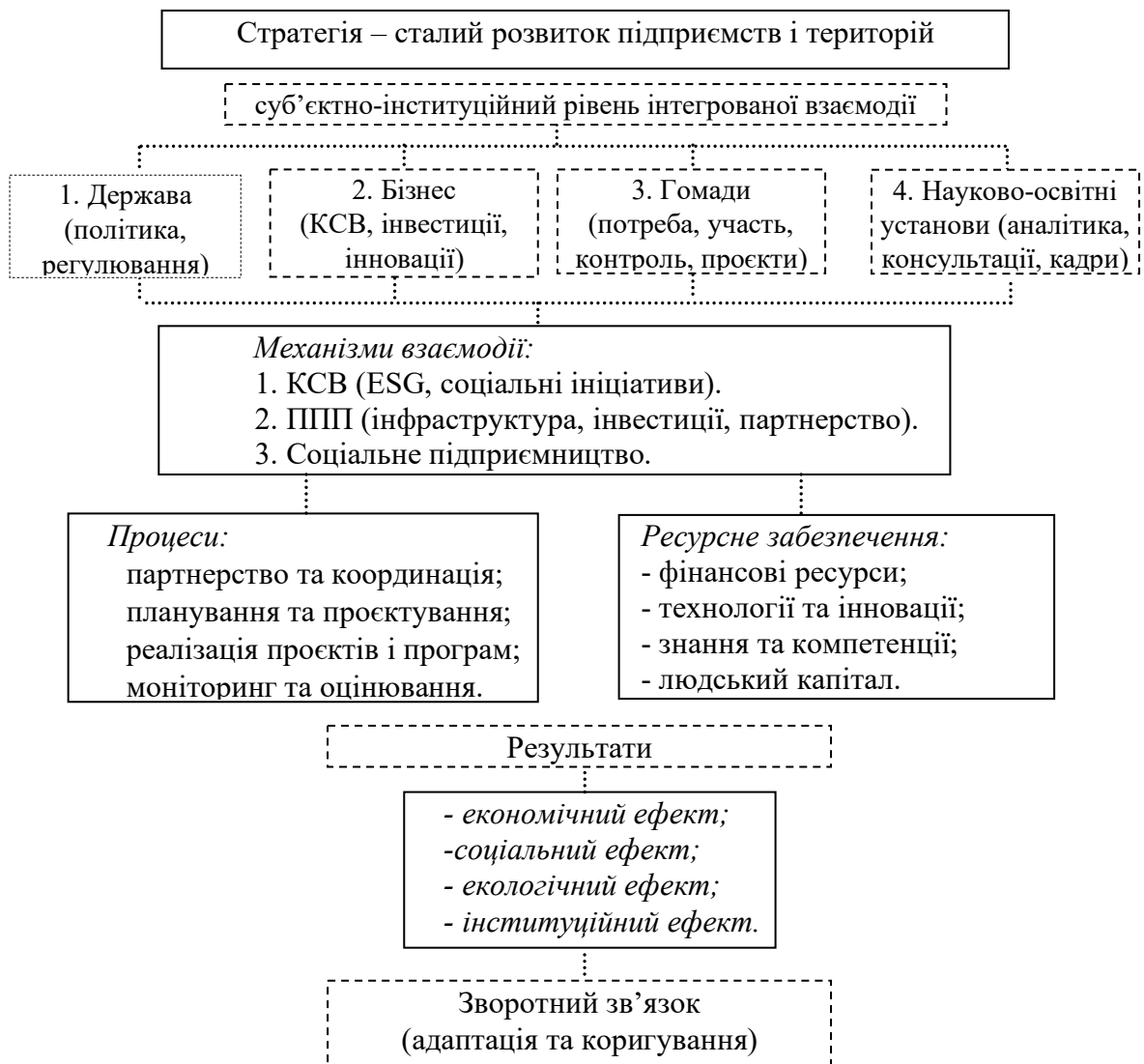
Рис. 2. Концептуальна модель інтегрованої взаємодії стейкхолдерів у системі забезпечення сталого розвитку*

Розуміння функціонального призначення кожного учасника дозволяє перейти до аналізу механізму їх інтеграції у загальну систему забезпечення сталого розвитку. Концептуальна модель інтегрованої взаємодії стейкхолдерів, представлена на рис. 2, відображає циклічний характер процесу, у межах якого стратегічні цілі трансформуються у конкретні управлінські механізми – ППП, КСВ та соціальне підприємництво.