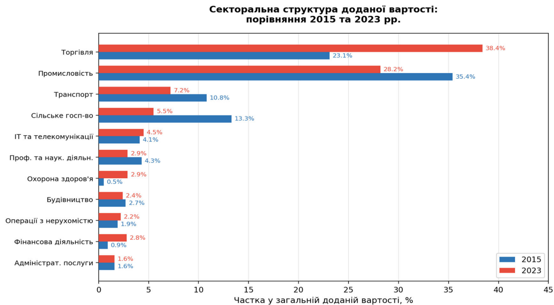
Рис. 3. Секторальна структура доданої вартості: порівняння 2015 та 2023 рр., %

вартості (1 102,7 млрд грн). До 2023 року їхня частка знизилася до 38,2 % (1 705,7 млрд грн), хоча в абсолютному вимірі зростання становило 54,7 %.