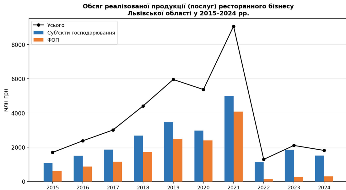
Рис. 3. Обсяг реалізованої продукції (послуг) ресторанного бізнесу Львівської області у 2015–2024 рр.

пояснюватися їхньою більшою вразливістю до кризових шоків: менші фінансові резерви, відсутність диверсифікації та залежність від локального попиту.