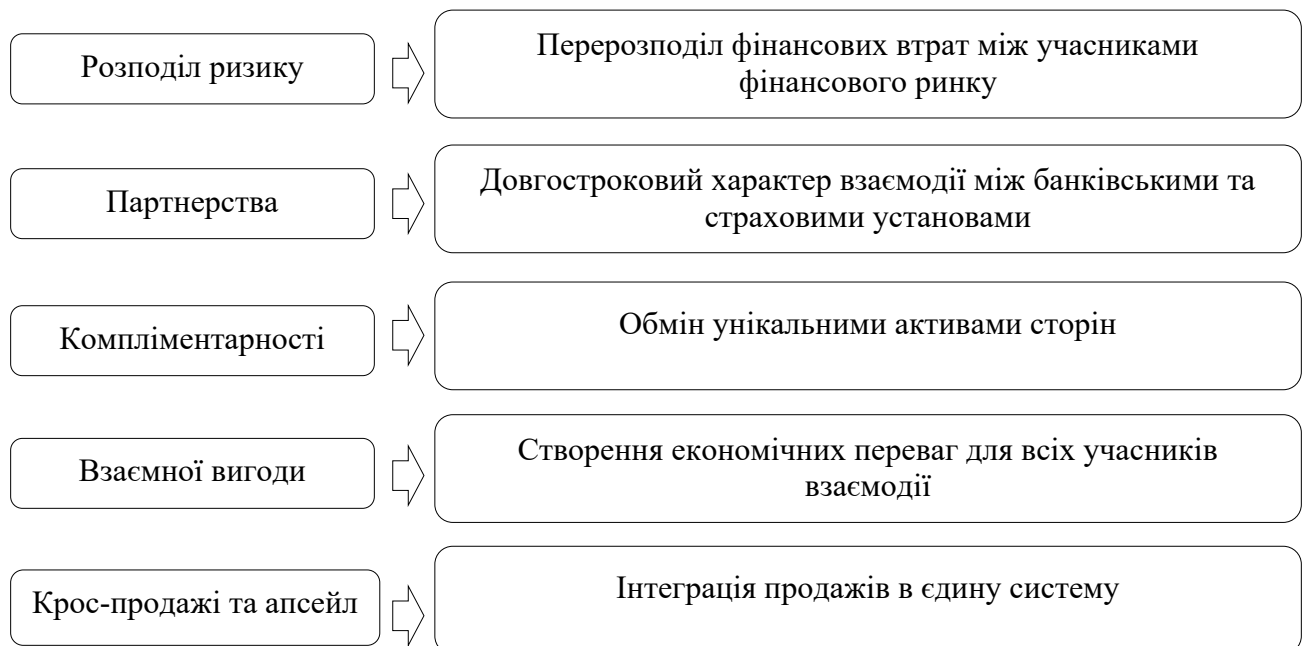
Рис.1. Основні принципи взаємодії банківського та страхового секторів

асортименту послуг, зростання клієнтської лояльності, диверсифікації прибуткових джерел та зменшення ризиків активних операцій завдяки страховому захисту. Страхові компанії, у свою чергу, отримують доступ до масштабної клієнтської мережі банків, скорочують витрати на розповсюдження продуктів та збільшують надходження страхових внесків. Ця модель функціонує не тільки як канал реалізації страхових послуг, але й як стратегічний механізм побудови комплексної системи управління фінансовими ризиками. Для банківських установ ключовим є страхування кредитних ризиків, яке допомагає зменшити вплив дефолтів боржників, підвищити якість кредитного портфеля та полегшити тиск на власний капітал. Крім того, страхування фінансових ризиків охоплює широкий спектр продуктів: страхування банківських гарантій, відповідальності фінансових посередників, інвестиційних транзакцій та інші спеціалізовані інструменти.