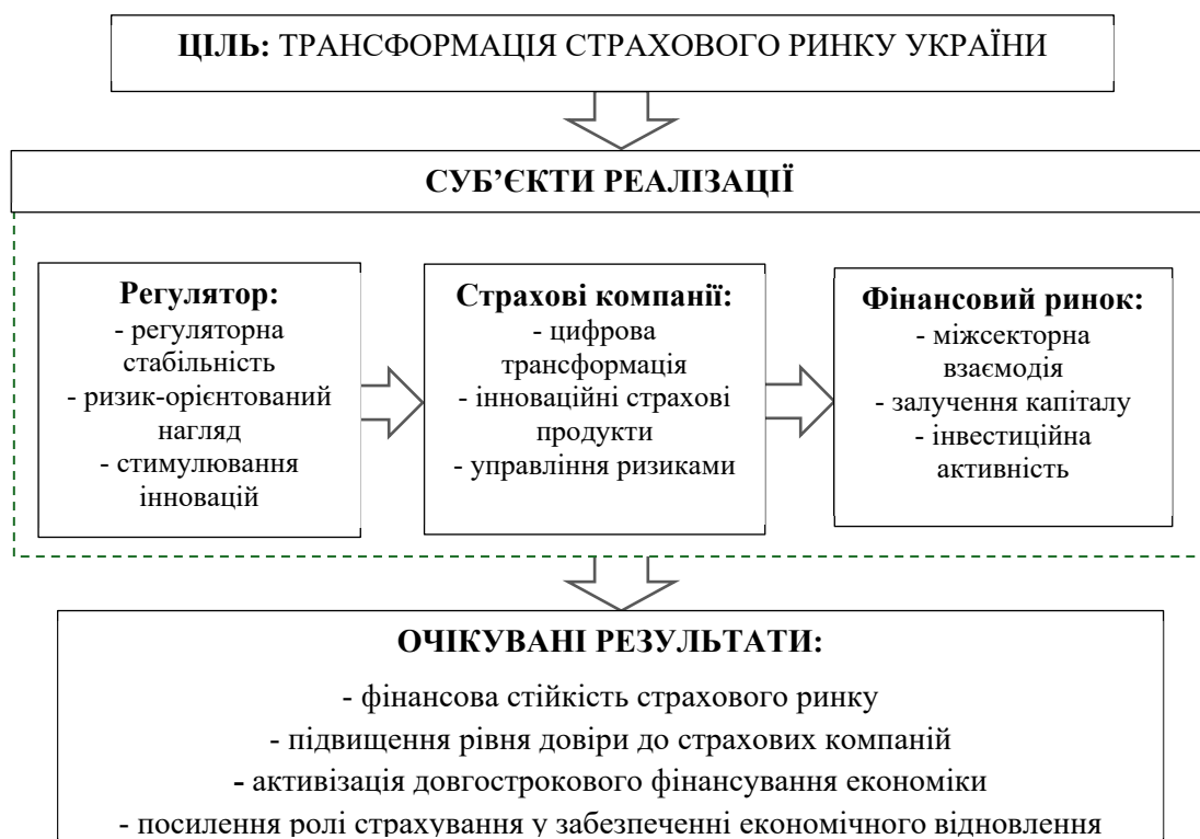
Рис. 4. Концептуальна модель трансформації страхового ринку України

Запропонований комплекс рекомендацій щодо трансформації страхового ринку України представимо на рис. 4.