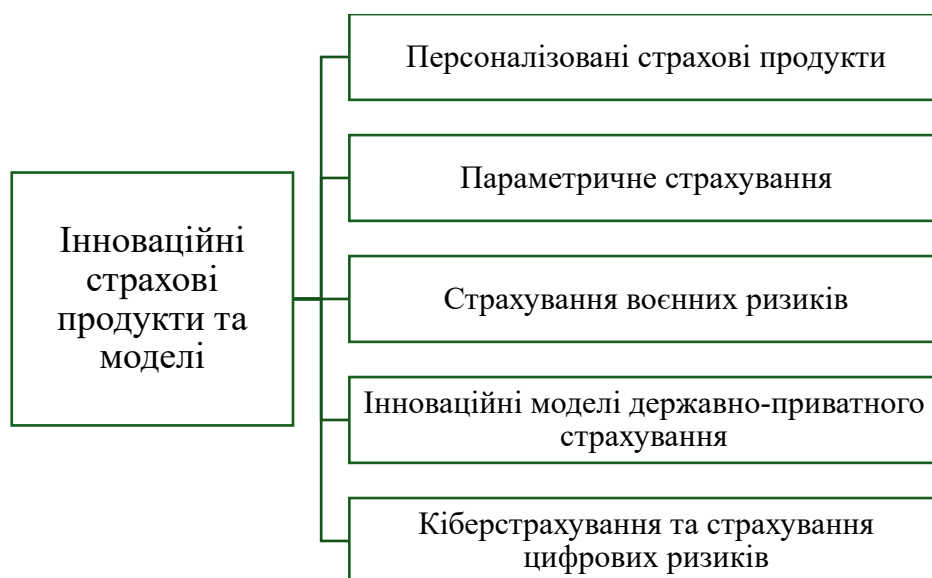
Рис. 2. Класифікація інноваційних страхових продуктів

Отже, основні складові інноваційного розвитку страхових продуктів систематизовано та відображено на рис. 2.