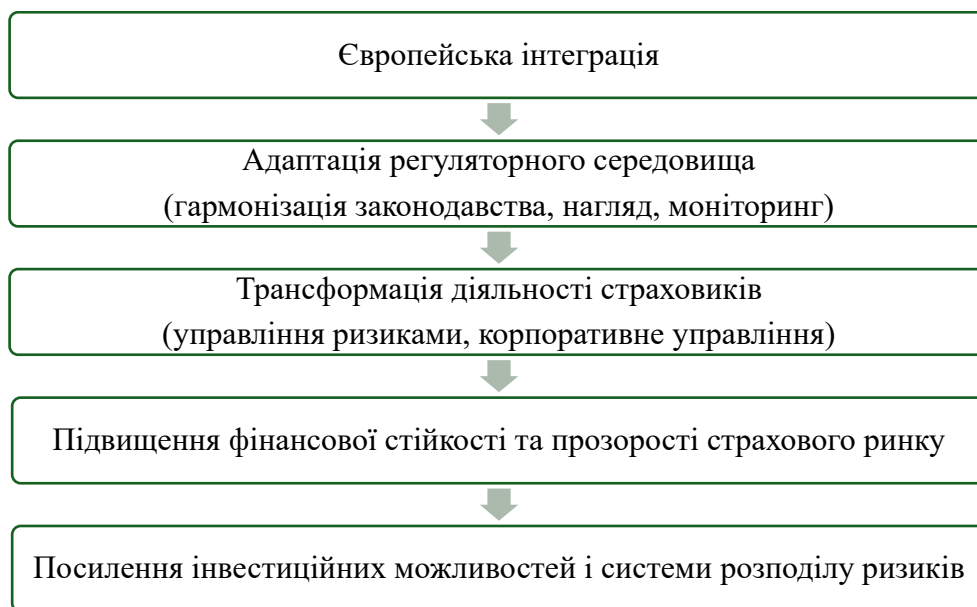
Рис. 3. Вплив європейської інтеграції на розвиток страхового ринку України

Вплив європейської інтеграції на трансформацію страхового ринку України відображено на рис. 3.